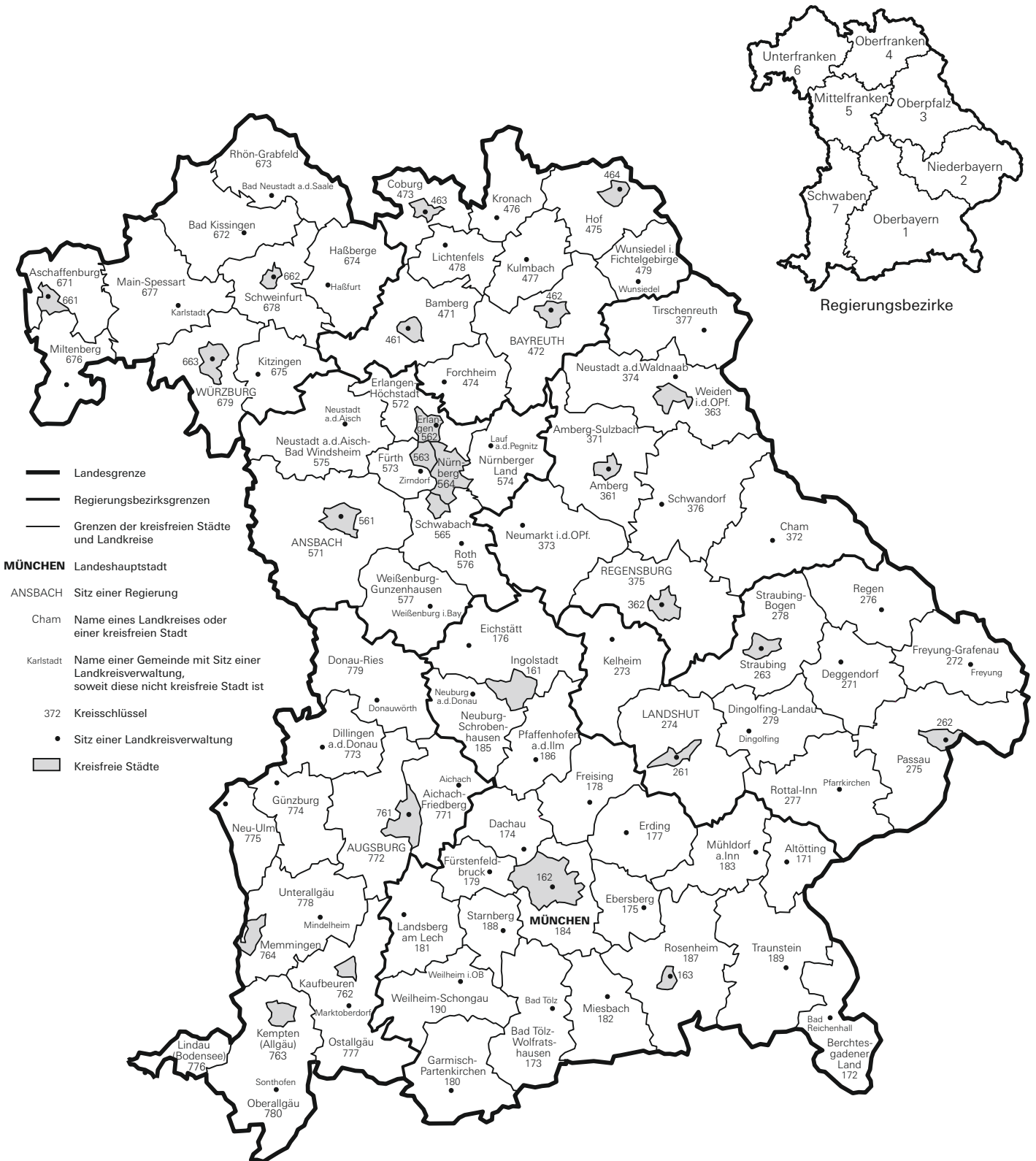
Abb. 1 Verwaltungsbezirksgliederung Freistaat Bayern Kreisfreie Städte, Landkreise und Regierungsbezirke Stand: 31. Dezember 2022